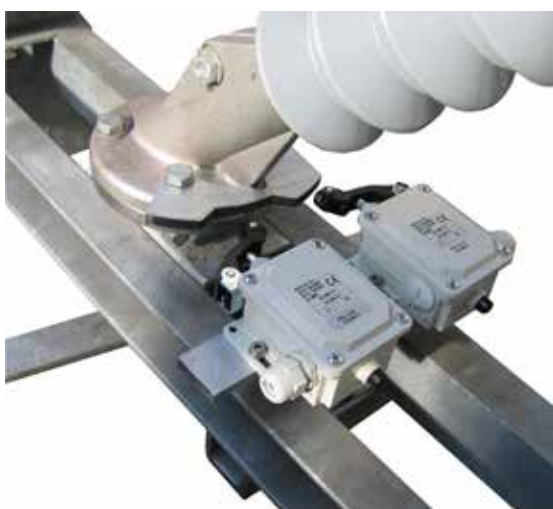
Particolare dispositivo opzionale di segnalamento

Isolatori Gomma siliconica Contatti Rame e bronzo fosforoso Particolari meccanici Ferro zincato a caldo, alluminio Viteria Inox A2, ove disponibile, altrimenti acciaio