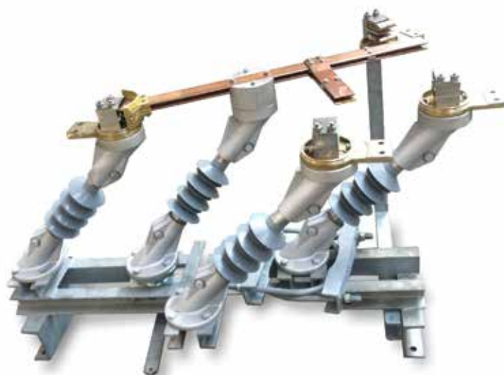
Versione con contatto per linea tampone con protezioni contatti rimosse